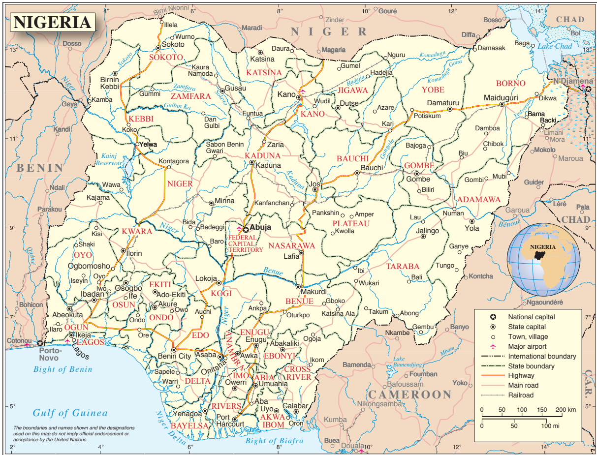
Carta 1: