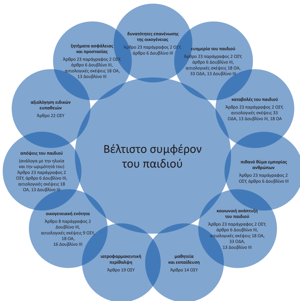
Διάγραμμα 1. Συμφέρον του παιδιού. Προσαρμογή από τον Πρακτικό οδηγό της EASO σχετικά με το βέλτιστο συμφέρον του παιδιού στις διαδικασίες ασύλου.

Επομένως, πρέπει να διενεργείται σε κάθε περίπτωση άμεση προκαταρκτική εκτίμηση της ευαλωτότητας, των ειδικών αναγκών και των κινδύνων (βλ. κεφάλαιο 2, Ειδικές ανάγκες και κίνδυνοι για την ασφάλεια) και στο στάδιο αυτό πρέπει να δρομολογείται εκτίμηση του βέλτιστου συμφέροντος. Οι ανωτέρω εκτιμήσεις πρέπει να διενεργούνται με σφαιρικό και τακτικό τρόπο σε συνδυασμό με τη συνεχή εκτίμηση του βέλτιστου συμφέροντος για όλες τις πράξεις και τις αποφάσεις που αφορούν παιδιά.